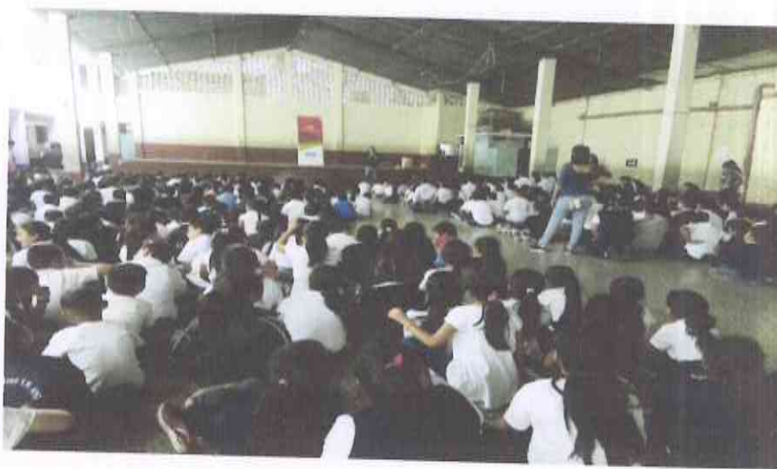
Presentación Escuela APG. 8a calle 3-38 zona 2. San José Villa Nueva