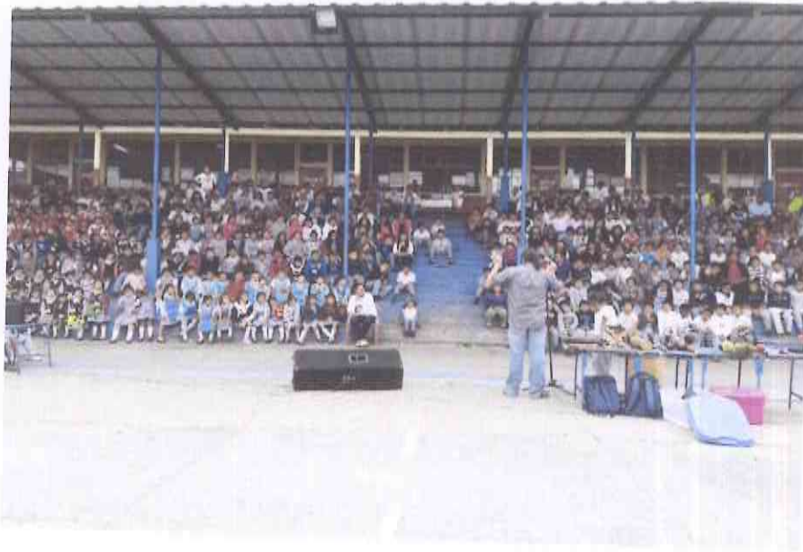
Presentación Escuela Mariano Rossell Arellano. Zona 6 Mixco Sección H Colonia el Milagro.