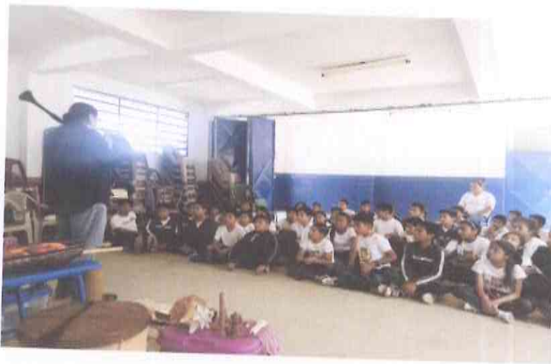
Presentación Escuela San José los Pinos. Colonia San José los Pinos Mixco.