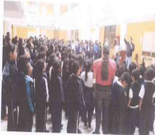
Presentación Escuela N. 815 JM. Lote 45 "A" Aldea el Pajon Santa Catarina Pínula