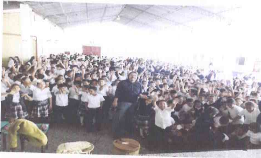
Presentación escuela San José los Pinos. Villa Nueva