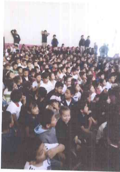
Escuela 616 americana. 1 av. 4-28 Zona 16 Concepción las lomas.