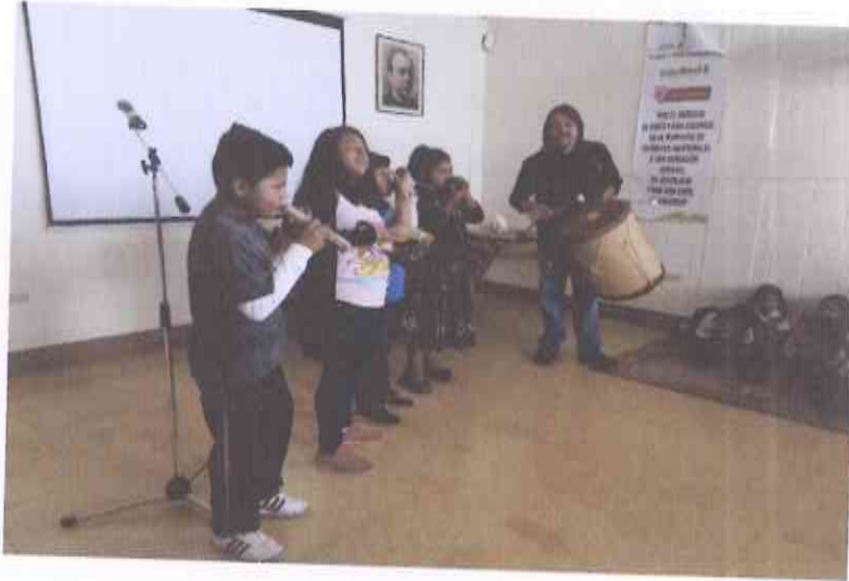
Presentación Proyecto socioeducativo Xajanaj Kahalepana. San Julian Chinautla.