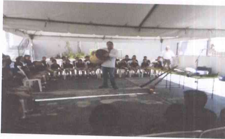
Presentación Proyecto de cooperación educativa y de desarrollo integral. Lomas de Santa Faz Zona 18